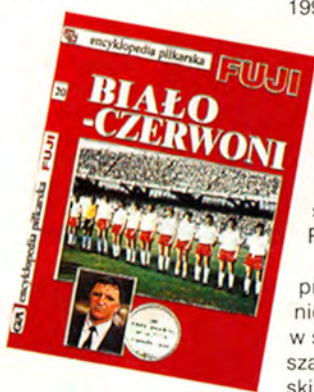
Zbigniew Boniek – laureat nagrody autorów rocznika Fuji

Bez wątpienia oba przedstawione wydawnictwa powinny mieć w swej bibliotece każdy szanujący się kibic piłkarski w Polsce. (ZM)