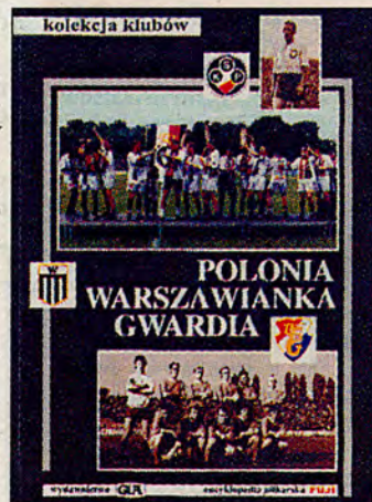
*Encyklopedia Piłkarska Fuji, kolekcja klubów, tom VII, „Polonia, Warszawianka, Gwardia”. Wydawnictwo GiA, Katowice 2003.

Redaktor Gówarzewski przeprosza też i prosi o wybaczenie za długie oczekiwanie na kolejny tom z serii kolekcji klubów. Jednakże wolno stwierdzić, iż pozycja poświęcona stołecznym Polonii, Warszawiance i Gwardii jest po pierwsze świetna merytorycznie, a po drugie – choćby poprzez spojrzenie spoza stolicy – obiektywna, pozbawiona lokalnych „naleciałości” i wymazywająca określone „białe plamy”. M.in. jeżeli chodzi o Gwardię. Przez wielu postrzeganą jako twór sztuczny, pozbawiony oparcia społecznego, co nie do końca jest prawdziwe. Ponadto nader szybko zapomnieliśmy o wcale pięknej karcie, jaką „Harpagony” i ich następcy zapisali w kronikach naszego ligowego i reprezentacyj-