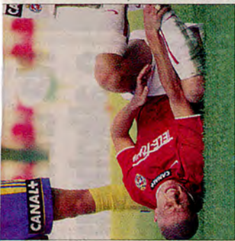
FOT. TOMASZ MARKOWSKI