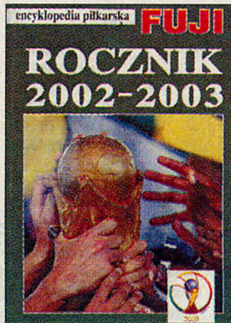
*Encyklopedia Piłkarska Fuji, tom 29, „Rocznik 2002-2003”. Wydawnictwo GiA, Katowice 2002.