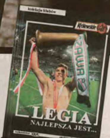
Okładka książki „Legia najlepsza jest...”

POZNAJ HISTORIĘ SWOJEGO KLUBU PIŁKARSKIEGO